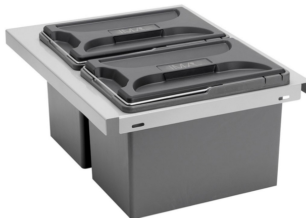
KUBEN - källsortering som passar i alla LIBs lådor.